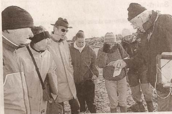
Ces stagiaires d'un jour ne verront plus l'estran de la même façon !

Concilier pratique du kayak et protection de l'environnement, c'est possible ! Encore faut-il que chacun connaisse bien la flore et la faune, les écosystèmes côtiers et sache que tout ce milieu naturel est fragile. C'est dans cet esprit que l'association costarmoricaine Interactions a organisé, ce week-end à Séné, une session de formation à l'environnement, en partenariat avec Bretagne vivante et le club de kayak de Vannes.